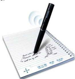
Skriv/spela in/spela upp

Koppla ihop smartpen med din dator så kan all lagrad information överföras från smartpen till datorn. Via en medföljande dator-applikation kan du nu bläddra bland dina digitaliserade anteckningar och även här lyssna till det inspelade ljudet. Du kan också enkelt skapa text-, ljud- eller multimediala pdf-filer av dina anteckningar. Dessa kan du spara eller skicka vidare till andra personer via t.ex. email. När pdf-filen öppnas med Adobe Reader kan mottagaren både se anteckningarna och höra det inkluderade ljudet.